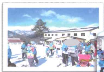
親子スキー教室&スノーシュー体験