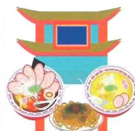
横浜中華街でランチ