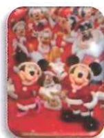
ディズニー・クリスマス バスツアー