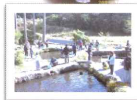
キャンプ&ますつり