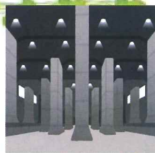
世界最大級の 地下放水路見学