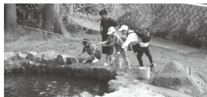
お昼ご飯をGET! ます釣り体験