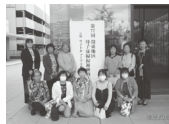
母子会から参加の皆さん