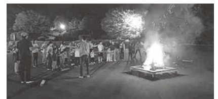
雨雲も逃げたカンパファイヤー

夕食後はお楽しみのカンパファイヤー!子どもも大人も楽しい時間を過ごすことができました。ラストはいわしピクニックさんの元氣一杯で心温まるミニコンサートで癒やされ、お風呂に入って就寝。 翌朝は、子どもたちもしっかり部屋の片付け、清掃をして、大崎つりぼりに出発!ます釣りに挑戦しました。 釣った魚はその場から揚げにしてもらい昼食にします。猛暑のため、魚も夏バテで食欲がなかったのか、なかなか割り当ての三匹が釣れない親子もいましたが、全員美味しい唐揚げを食べることができました。 新しいことを体験し、参加者同士の交流も深まった大満足の二日間となりました。