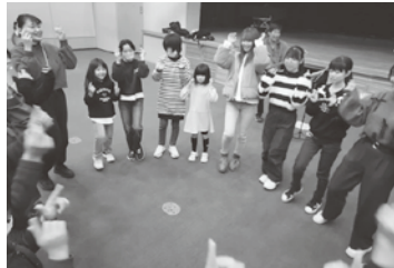
みんなで楽しくクリスマスレク(高崎)