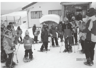
大雪のためゲレンデでスノーシュー体験