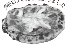
美味しく焼き上がりました