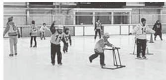
まずは補助具を使って・・・