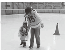
上手に滑れました