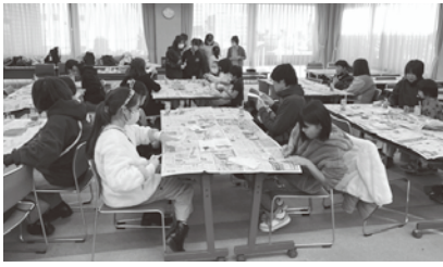
クリスマスキャンドル作り(前橋)

この事業は、子どもの居場所づくりとともに、保護者同士の情報交換や交流を目的として毎年実施しているものです。