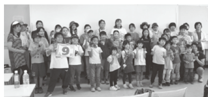
完成した作品を手に全員でパチリ!