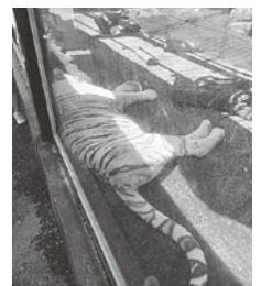
暑さでホワイトタイガーもぐったり