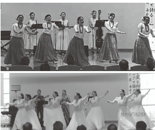
会場を魅了したフラ

ハワイの子育てやフラの歴史、ハワイと日本のつながりなど、ご自身の経験を交えながらのお話は、生演奏と群馬県立女子大学フラチームの演技とともに、参加者の心にしみわたりました。